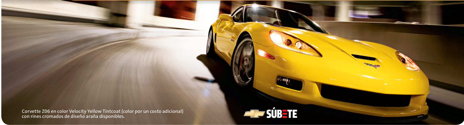
Corvette Z06 en color Velocity Yellow Tintcoat (color por un costo adicional) con rines cromados de diseño araña disponibles.

El increíble Corvette cupé tiene la capacidad de ir hasta 190 MPH en la pista de prueba y un estimado EPA de 26 MPG en carretera 1 . El Z06 puede llegar a correr hasta 198 MPH en la pista de prueba y rinde un estimado EPA de 24 MPG en carretera 2 . Y ahora va más allá de tus expectativas con el regreso del Corvette ZR1 3 . Equipado con un motor supercharged V8 LS9 con 638 caballos de fuerza que alcanza una velocidad máxima en la pista de prueba de 205 MPH. No hay duda que el Corvette es un auto para los que siguen sus propias reglas.